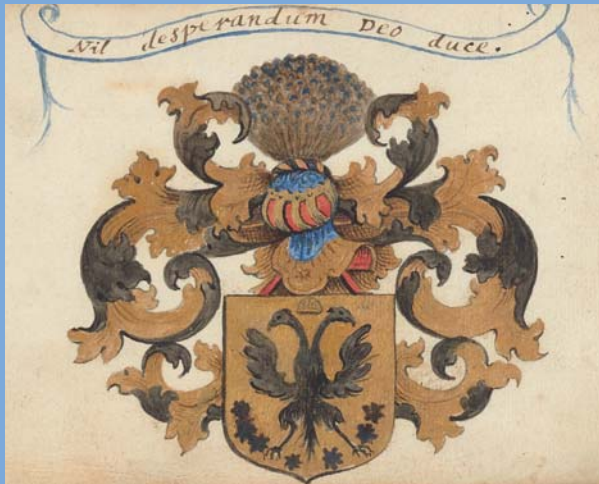
ALLARD PIERSON | UNIVERSITEIT VAN AMSTERDAM, HS. V. J. 50

Wat een genoegen moet het zijn om in uw tijd te leven! U hebt toegang tot een onbeperkte hoeveelheid kennis en inzichten. Uw regering zegt zich te laten leiden door de Rede. U hebt de onbeperkte vrijheid om te zijn wie u bent en te denken en te zeggen wat u wilt. Kortom: de waarden waarvoor ik in het Rasphuys werd opgesloten, zijn in uw tijd vanzelfsprekend geworden. Maar waar ik mij in mijn graf van omdraai, is dat die vanzelfsprekendheid leidt tot verwaarlozing.